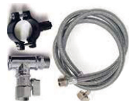
Kit di installazione